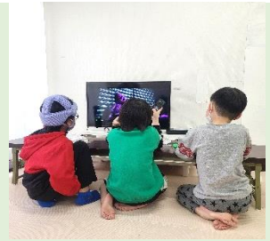
うし すがた ♡ かわいい後ろ姿 ♡