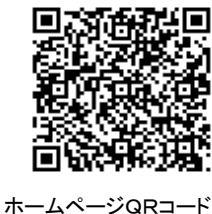
ホームページQRコード

この頃気温がよく変わります。体調管理には気をつけたいものです。 さて、お子さんたちの成長の速さを実感する場面も多いです！何かご家庭でお気づきの点やご要望などありましたら遠慮なく声をかけてください。 2019/6/14